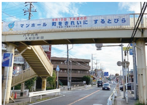
横断幕(八千代市大和田新田)

8月14日から1カ月間、国道126号(旧16号)千葉市穴川、国道357号ポートアリーナ、浦安駅前、国道14号船橋市宮本、国道356号印西市大森、松戸野田線流山市南流山、国道296号八千代市大和田新田に設置されているそれぞれの歩道橋に標語入り横断幕を掲出しました。