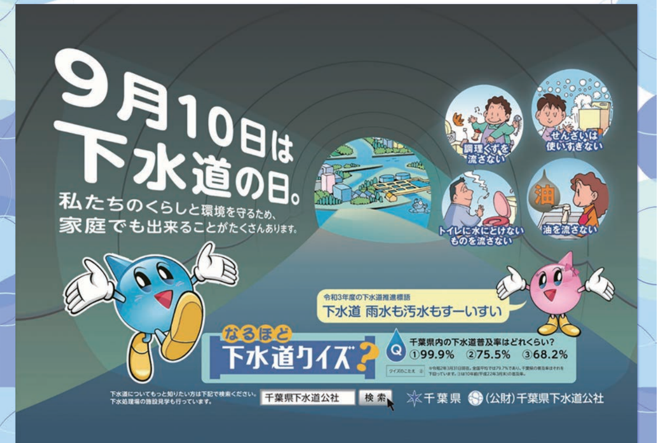
令和3年度下水道推進標語「下水道 雨水も汚水もすーいすい」をデザインしたポスター

例年では当該年度に実施した普及啓発活動についてご紹介しておりますが、昨年度と同様で今年度も新型コロナウイルス感染症の影響により、各種イベントが中止になりました。そのような状況下で実施した啓発活動についてご紹介させていただきます。