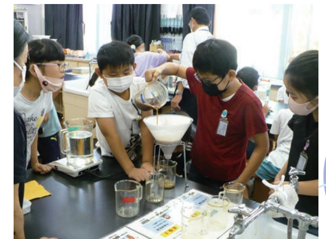
みんなで協力して頑張っています。

最後に下水道の正しい使い方などを説明して、水環境に負荷をかけない生活を家族で取り組んでもらうようお願いをしました。