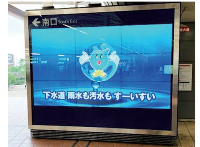
大型ビジョン(流山おおたかの森駅)

複数路線が乗り入れ、多くの人々が行き交う「海浜幕張駅」や「柏駅」、「流山おおたかの森駅」に設置されている大型ビジョンで下水道の日や下水道の適切な使い方などをPRするCMを放映しました。